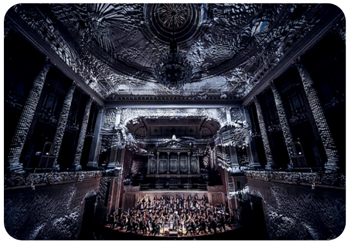
Nohlab : Sim Nebula Part V : New World , Rudolfinum, Prague, 2016