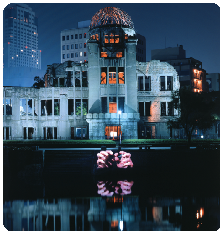
Krzysztof Wodiczko : Hiroshima Peace Memorial (A-Bomb Dome), 1991