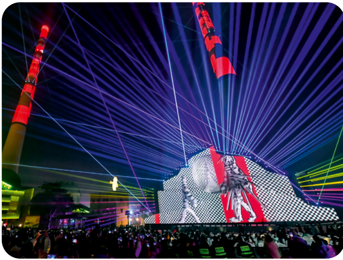
SKG+ : 2 e Chongqing International Light Art Festival, 2024