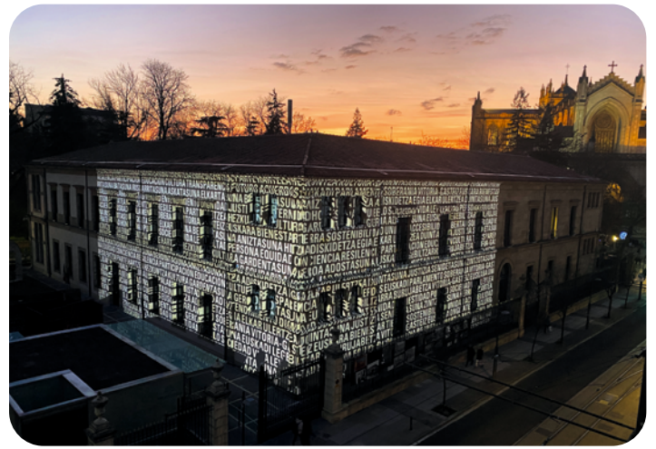
[Video Mapping Awards] Hartung | Trenz : HAZIAK - SEMILLAS, Parlement basque, Vitoria-Gasteiz, Umbr Light Festival 2023