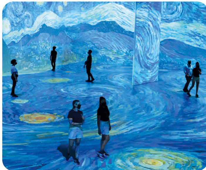
[Xn Québec] Normal Studio : Beyond Van Gogh, 2021