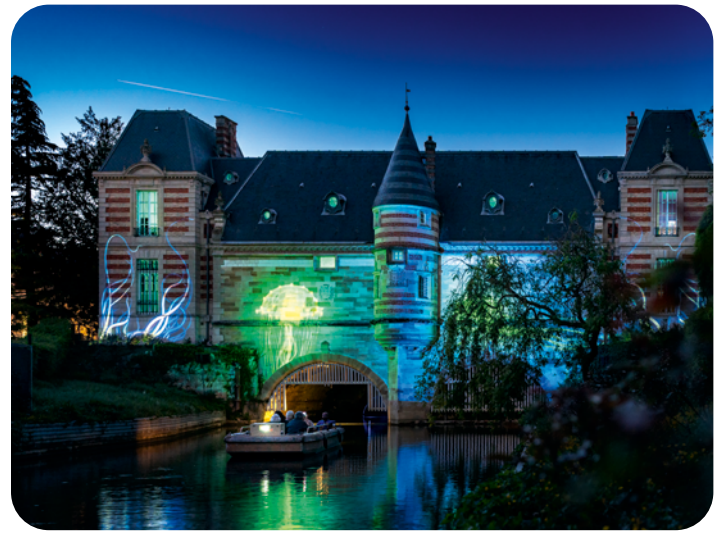
[Table ronde Installations pérennes] Office de Tourisme de Châlons-en-Champagne : Métamorph'eauses, 2022