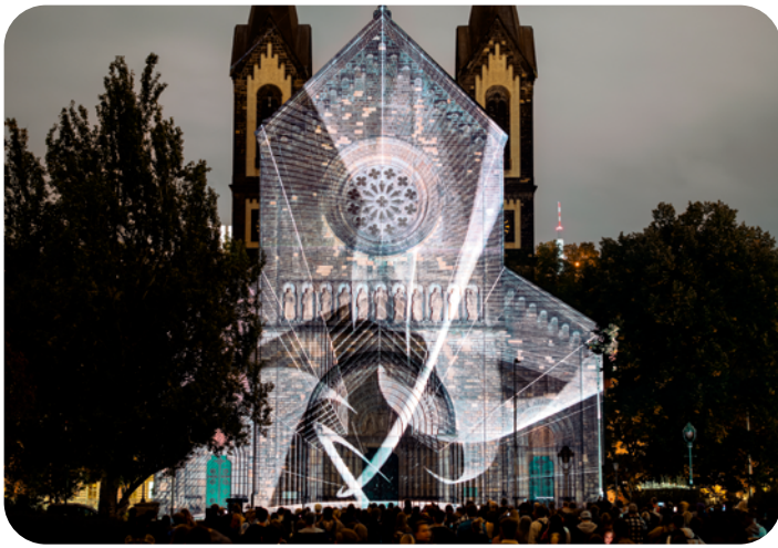
[Video Mapping Awards] FLIGHTGRAF : ECHO, Cathédrale Saints-Cyrille-et-Méthode, Prague, Signal Festival 2023